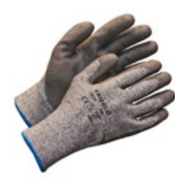
Proglo 1020 viiltosuojäkäsine C-luokka 651-PROGLO-1020 PU-pinnoitettu viiltosuojäkäsine HPPE-kuitua. Viiltosuojaluokka C. Erinomainen kulutuskestävyys sekä viiltosuojaluokka. Hyvin käteen muotoutuva, joustava ja pitävä malli hyvällä sormituntumalla. Hengittävä selkäosa ja saumaton rakenne parantavat toimivuutta.