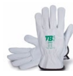
Nahkakäsine 160 IBSZ vuoriton 651-110IV Naudan pintanahasta valmistettu käsine. Vuoriton. Hengittävä, mukava ja joustava.