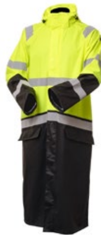
Priha 4312 pitkä sadetakki 6500-4312

Huomiovärinen sadeasusetti kelta/musta -taksi EN 20471 Lk.3 ja housut EN 20471 Lk.1 - 4308 100% kudottua polyesteriä, jossa polyuretaanipinnoite.