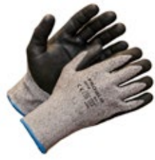
Proglo 2020 viiltosuojäkäsine B-luokka 651-PROGLO-2020 Proglo 2020 on nitrilillä pinnoitettu viiltosuojäkäsine HPPE-kuitua. Viiltosuojaluokka B. Erittäin hyvän pidon mahdollistava pintamateriaali ja erinomainen kulutuskestävyys. Hyvin käteen muotoutuva ja joustava malli hyvällä sormituntumalla.