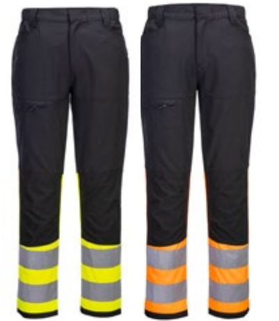
Portwest CD888 huomiohousut LK1 6500-CD888

Tässä WX2 huomiohousuissa on 4 tilavaa taskua. Joustava vyötärö sekä 4-suuntaan joustavat kankaat takaavat erinomaisen mukavuuden ja istuvuuden.