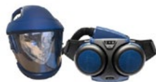
Sundström SR500/SR570 puhallinsarja 6542-SR500-SR570

Moottoroitu hengityssuojain 3M PF-619E+ aloituspakkaus ilman kasvo-osaa. Puhaltimella varustettu hengityssuojain, joka on suunniteltu käytettäväksi ankarissa ympäristöissä. Helppokäyttöisessä puhaltimessa on kehittyneitä ominaisuuksia mm. elektroninen ilmavirtauksen säätö, visuaalinen näyttö, äänihälytys varoittaa akun alhaisesta lataustilanteesta ja integroitu akku.