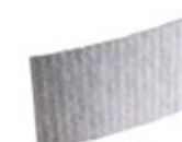
3M Adflo 836010 esisuodatin 5kpl/pkt 253M-836010

Esisuodatin 3M Adflo-puhaltimeen. Pidentää hiukkassuodattimen käyttöikää merkittävästi erityisesti karkeaa pölyä suodatettaessa.