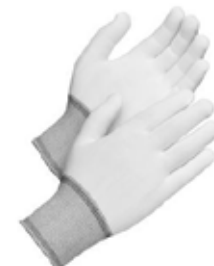
Worksafe L75-723 aluskäsine polyesteri 651-40530723 Ohut käsine 100 % polyesteriä. Soveltuu kevyisiin töihin, joissa tarvitaan hyvää sormituntumaa.