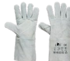
Merlin hitsauskäsine vuoriton 651-010200 Vuorittomat hitsaajan käsineet, materiaalina naudan haljasnahka.