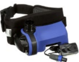
3M PF-619E+ puhallinsarja 109-PF-619E+

Valmis puhallinsuojainpaketti eri työympäristöihin. Soveltuu mm. pölyisiin teollisuusympäristöihin, mukaan lukien ympäristöt, joissa esiintyy kaasuja ja höyryjä. Myös kemian teollisuuteen ja laboratorioihin. Rakennus-, auto- ja laivanrakennusteollisuus. Hitsaukseen, hiontaan ja pintakäsittelyyn sekä maataloustöihin. Paketti sisältää: Puhallinsuojain CleanAIR® Chemical 2F, Kasvonsuojain CleanAIR® UniMask helposti puhdistettavalla neopreeniivisteellä ja CleanAIR® Klar-pilot puhdistusneste (17 ml). Tuotteet pakattu käteväan muovisalkkuun.