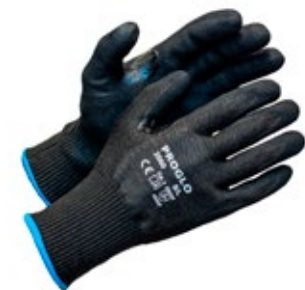
Proglo 2060 viiltosuojäkäsine F-luokka 651-PROGLO2060 Nitrilipinnoitettu F-luokan viiltosuojäkäsine UHMWPE-kuitua/spandexia. Vahvistettu peukalonhanka. Toimii kosketusnäyttöillä. Erinomainen viiltosuojaus ja kulutuskestävyys. Viiltosuojaluokka F.