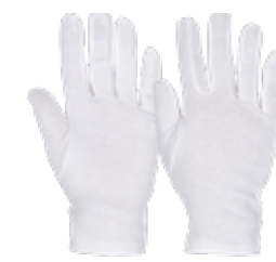
OS Inspector aluskäsine 651-370090 Neulottu aluskäsine. Materiaali: 100 % puuvilla.