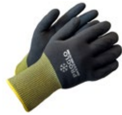
Proglo 2500 talviviiltosuojäkäsine B-luokka 651-PROGLO-2500 Vaahdotetulla nitrilillä pinnoitettu viiltosuojäsormikas. Lämmin harjattu akryylivuoraus. Pitävä ja joustava käsine myös viileisiin olosuhteisiin. Viiltosuojaluokka B. Mekaanista kulutusta kestävä ja erinomaisesti käteen istuva malli.