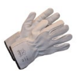
Protect T 106 V nahkakäsine 651-T106V Työasormikas, kestävä naudannappakämmentä, nautahjasselkä, vuoriton.