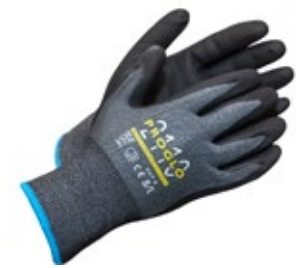
Proglo 2110 viiltosuojäkäsine C-luokka nitrili 651-PROGLO2110 Ultraohut (21gg) ja pitävä C-luokan viiltosuojäkäsine UHMWPE-kuitua. Mikrovaahdotetulla nitrilillä pinnoitettu nylon/spandex-sormikas. Erinomainen valinta, jos työssä tarvitaan viiltosuojasta, mutta käsiin tulee kuitenkin olla mahdollisimman ohut ja mukava käyttää. Toimii myös kosketusnäyttöillä. OEKO-TEX® luokitus.