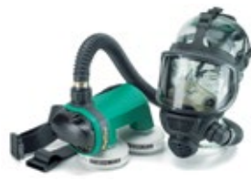
3M PF-619 Asbesti + FF-302 puhallinsarja 6542-PF-600E-ASB-FF-302

Sundström puhallinsuojainpaketti SR700- puhaltimella ja SR200-kasvonsuojaimella. SR 700 Hiukkassuodatinpuhallin. Paketin sisältö: puhallin, 2 kpl P3-hiukkassuodattimia, vakioakku, latauslaite, vyö ja käyttöohje. SR 200 Kokonaamari. SR 550 Letku. Hyväksynnät: EN 12942:1998 luokka TM3. IP 67. Paketti on suunniteltu erityisesti raskaisiin, kuumiin tai pitkäkestoisiin töihin. SR 700 Hiukkassuodatinpuhallin.