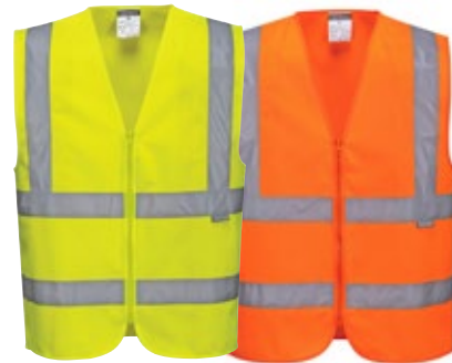
Portwest C375 huomioliivi 6500-C375

High vis työnjohtajan liivi LK2 on vastuullinen huomioliivi, joka on tehty luomupuuvillasta ja kierrätetystä polyesteristä. Kestävä ja kevyt materiaali. Käytännölliset taskut vetoketjuilla ja napeilla säädettävä helma. EPD (Environmental Product Declaration) ympäristöselosteilla.