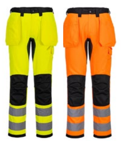
Portwest CD889 LK2 huomiohousut riipputaskuilla 6500-CD889

Joustavat huomiotyöhousut on suunniteltu parantamaan työmukavuutta joka päivä. 2-suuntaista stretch-kangasta täydentää takana 4-suuntainen joustokappale, joka lisää liikkumisen vapautta ja kestävyttä. Kneeguard™ Pro -polvisuojajärjestelmä suojaa polvia, ja polvien lisäsuojana ovat CORDURA®-vahvistetut polvisuojataskut. CODURA®-vahvistetut taskut parantavat kestävyttä, ja työkalupidikkeet antavat lisäsäilytystä.