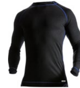
Fristads 7517 MW merinovillainen aluspaita 6500-127442

Fristads 7416 UE alusasu nopeasti kuivuvasta ja kosteutta siirtävästä materiaalista. Pitkät hihat, pyöreä pääntie ja tehosteväriset koristetikkaukset.