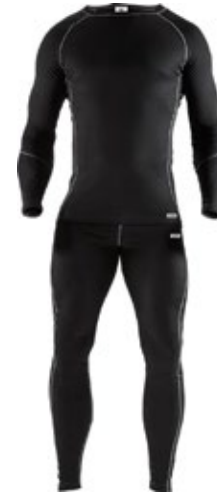
Fristads 7416 UE tekninen alusasu 6500-127382-

Fristads 7416 UE alusasu nopeasti kuivuvasta ja kosteutta siirtävästä materiaalista. Pitkät hihat, pyöreä pääntie ja tehosteväriset koristetikkaukset.