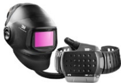
3M Speedglas G5-01 puhallinsarja G5-01TW 109-617820 G5-01VC 109-617830

Raskaan teollisuuden ympäristössä työskenteleville 3M™ Adflo™ -sarjan moottoroitu hengityssuojain tarjoaa yhdessä Speedglas™ G5-01 -sarjan raskaan käytön hitsausmaskijärjestelmän kanssa tehokasta hiukkashengityssuojaa hitsaajille kestävällä mutta pienikokoisessa rakenteessa, johon kuuluu myös ergonominen säädettävä päänauhasto.