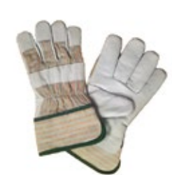
Työkäsine 110I/V pukinnahka/kangas ilman vuorta 651-110IV Vuoriton nahkakäsine. Käsiin kämmenpuoli on pukinnahkaa ja kämmenselkä kangasta. Kat. I. Yksi koko (10,5)