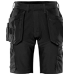
Fristads 2598 LWS rakentajan stretch shortsit 6500-134119

Sadetakki tarjoaa erinomaisen vedenpitävyyden ja hengittävyuden (5000/5000), on joustava, kevyt, pehmeä eikä kahise. Saumat ovat teipatut ja ommellut, ja kauluksessa on huppu. Takissa on kaksi sivutaskua, tuuliliistä ja puolivälistä ylös asti ulottuva vetoketju kiinnitys, jossa alaosassa on nepparit.