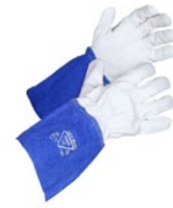
Hand1A 1421 Light Welder TIG-hitsauskäsine 651-W1421 Hieman istuvampi TIG-hitsauskäsine lampaan pintanahasta. Turvaranneke haljasnahkaa.