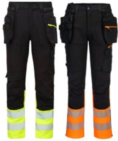
Portwest DX457 huomiohousut riipputaskuilla LK1 6500-DX457

DX4 Hi-Vis -luokan 1 riipputaskuhousuissa on käytetty 4-suuntaan joustavaa kangasta, jotta liikkuminen olisi mahdollisimman vaivatonta. Housuissa on takaa korotettu joustava vyötärölinja, joka tarjoaa suojaa ja mukavuutta kaikissa työasennoissa. Esitaivutetut ylhäältä täytettävät polvisuojataskut, reilun kokoiset etutaskut ja irrotettavat riipputaskut sekä vetoketjujullisia säilytystaskuja. Kolminkertaiset ompelut takaavat maksimaalisen kestävyden.