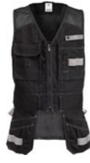
Fristads 5905 CYD työkaluliivi 6500-121315-940

Liiviosa on helppo pukea päälle, ja ulkotöihin on vakiona mukana etuosan laajennuskappale, jolloin Timperin voi pukea vaikka turkishaalarin päälle. Taskut ja kotelot on valmistettu aidosta nahasta. Saatavana myös valjasvalmiudella.