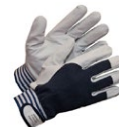
Työkäsine T 109 VSR nahka puuvillaselkä tarralla 651-T109VSR Asentajan työasormikas, vuohennahka, joustava kangasselkä, tarraranneke, vuoriton.