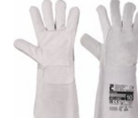
Crane hitsauskäsine vuoriton 651-0102000899 Materiaali naudan pinta- ja haljasnahka.