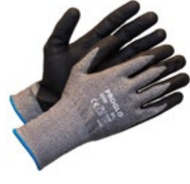
Proglo 2050 viiltosuojäkäsine C-luokka nitrili 651-PROGLO2050 Proglo 2050 on äärimmäisen ohut (18g) mikrovaahdotetulla nitrilillä pinnoitettu spandexvuorattu viiltosuojäkäsine UHMWPE-kuitua. Erittäin hyvän pidon mahdollistava pintamateriaali ja erinomainen kulutuskestävyys.