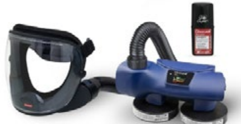
CleanAIR Chemical 2F + UniMask Ready Pack puhallinsarja 6542-CA510348.08

CleanAIR AerGO + UniMask Ready Pack on valmis puhallinsuojainpaketti eri työympäristöihin. Se on erittäin ergonominen ja helppokäyttöinen, heti käyttövalmis paketti. Tuotteet on pakattu käytännölliseen ja kestäväan muoviseen säilytyslaatikkoon. Suodatinpakettia vaihtamalla AerGo voi suojata sekä hiukkasilta että kaasulta. Soveltuu mm. pölyisiin teollisuusympäristöihin, mukaan lukien ympäristöt, joissa esiintyy kaasuja ja höyryjä. Rakennus-, auto- ja laivanrakennusteollisuus. Hitsaukseen, hiontaan ja pintakäsittelyyn sekä maataloustöihin.