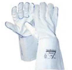
Hand1A 1404 Hitsaajan käsine vuoriton 651-704BGK Naudan pinta- ja haljasnahkaa. Teresuojattu kevlar-ommel. Vuoriton. Vahvistettu turvaranneke suojaa rannetta ja vaatteiden hihoja.