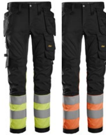
Snickers 6234 huomiohousut riipputaskuilla LK1 6500-62340

Fristads Green 2643 GSTP High vis rakentajan stretch housut LK1 ovat vastuulliset rakentajan stretch huomiohousut. Valmistettu biopohjaisesta ja kierrätetystä 4-suuntaan joustavasta stretch-materiaalista. Stretch-paneelit vyötäröllä tuovat erinomaisen mukavuuden ja vahvikkeet kulutukselle alttiilla alueilla takaavat kestävyden. EPD (Environmental Product Declaration) ympäristöselosteilla.