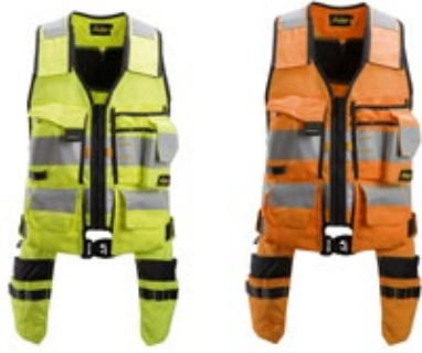
Snickers 4230 huomiotyökaluuliivi 3140-H4230

Huomiotyökaluuliivi on jokapäiväiseen käyttöön suunniteltu monipuolinen työkaluliivi. Liivi on harkitusti suunniteltu käytännölliseen työkalujen kuljetukseen ja säilytykseen, ja siinä on puhelintasku, ID-henkilökortin pidike, riipputaskut ja edessä työkalutaskut.