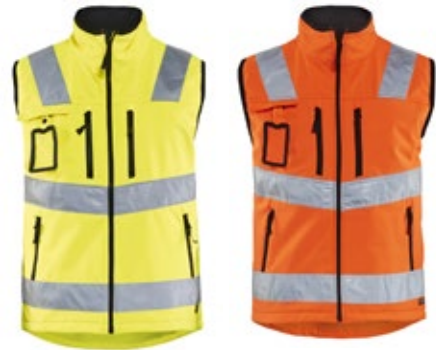
Blåkläder 30492517 työnjohtajan liivi

liivi on klassinen säädettävä rakentajan liivi, jossa on takana verkkotuuletusaukot ja monia toiminnallisia taskuja. Leveyttä voi säätää lisävetoketjun avulla, jolloin liiviä voi käyttää myös takin päällä.