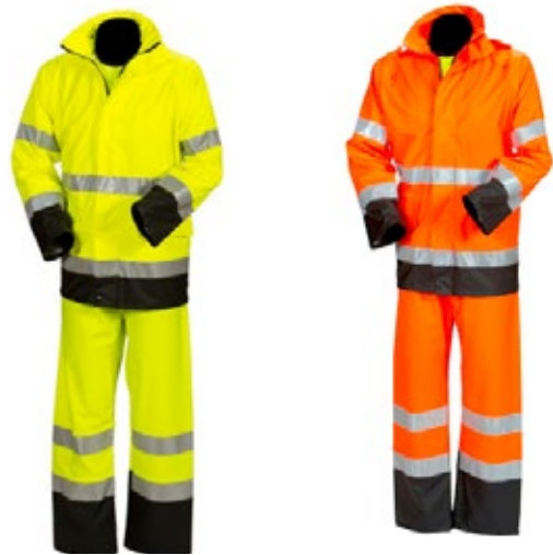
Priha 4308/ 4309 sadeasusetti huomioväri 6500-430

Huomiovärinen sadeasusetti kelta/musta -taksi EN 20471 Lk.3 ja housut EN 20471 Lk.1 - 4308 100% kudottua polyesteriä, jossa polyuretaanipinnoite.