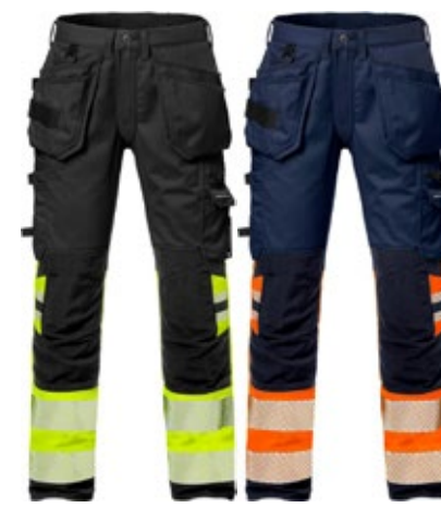
Fristads 2706 PLU huomiohousut riipputaskuilla, stretch LK1

Kahteen suuntaan joustavat korkean näkyvyyden työhousut parantavat liikkuvuutta ja optimaalista mukavuutta ja turvallisuutta työssä, joka vaatii lisänäkyvyyttä. Housuissa on ainutlaatuinen KneeGuard™-järjestelmä, ja niitä on vahvistettu edelleen CORDURA®-polvisuojataskuilla. Lisäksi CORDURA®-vahvike reisitaskujen pohjassa lisää kestävyttä, kun taas työkalupidikkeet mahdollistavat lisäsäilytyksen.