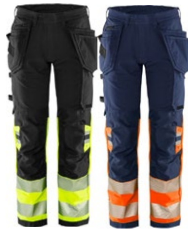
Fristads Green 2643 GSTP huomiohousut riipputaskuilla s tretch LK1

DX4 Hi-Vis -luokan 1 riipputaskuhousuissa on käytetty 4-suuntaan joustavaa kangasta, jotta liikkuminen olisi mahdollisimman vaivatonta. Housuissa on takaa korotettu joustava vyötärölinja, joka tarjoaa suojaa ja mukavuutta kaikissa työasennoissa. Esitaivutetut ylhäältä täytettävät polvisuojataskut, reilun kokoiset etutaskut ja irrotettavat riipputaskut sekä vetoketjujullisia säilytystaskuja. Kolminkertaiset ompelut takaavat maksimaalisen kestävyden.