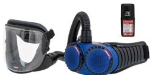
CleanAIR AerGO + UniMask Ready Pack puhallinsarja 6542-CA300300.01

Monipuolisiin hitsausympäristöihin tarkoitettu 3M™ Adflo™ Moottoroitu hengityssuojain yhdessä Speedglas™ G5-03 Pro Air Hitsausmaskin kanssa tarjoaa tehokasta hiukkassuojaa hitsaajille. Järjestelmä on kestävä ja kompakti, ja siinä on ergonominen, säädettävä päänauhasto. 3M™ Adflo™ Moottoroitu hengityssuojainta voidaan käyttää yhdessä korkean suodatustehon hiukkassuodattimen kanssa (ei sisälly)