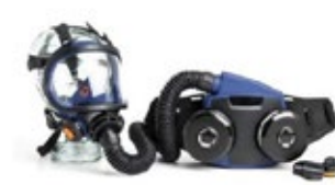
Sundström SR700/SR200 puhallinsarja 6542-SR700-SR200

Sarja, johon kuuluvat SR 500 -puhallin ja SR 570 -kasvosuojus. Sisältää SR 500 -puhaltimen, SR 570 -kasvosuojuksen, yhden suojakalvon, STD-akun, SR 513 -akkulaturin, SR 508 -hinnan, 2 kpl SR 510 P3 R -hiukkassuodattimia, 2 kpl suodattimen liitoskappaleita, 2 kpl SR 221 -esisuodattimia, 2 kpl esisuodattimen pidikkeitä, virtausmittarin, pistokesarjan, puhdistusliinan ja käyttöohjeet