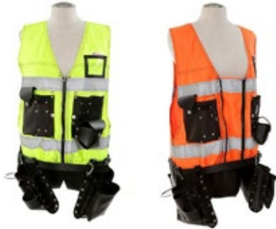
Timperi huomiotyökaluuliivi 6500-TIMPERI-

Huomiotyökaluuliivi on jokapäiväiseen käyttöön suunniteltu monipuolinen työkaluliivi. Liivi on harkitusti suunniteltu käytännölliseen työkalujen kuljetukseen ja säilytykseen, ja siinä on puhelintasku, ID-henkilökortin pidike, riipputaskut ja edessä työkalutaskut.