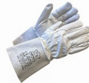
Protect HK 402 TIG-hitsauskäsine 651-HK402TIG TIG-hitsaajansormikas, kestävä ja pehmeä vuohennahkakämmentä ja selkäosa, varsiosa nautahjaljasta.