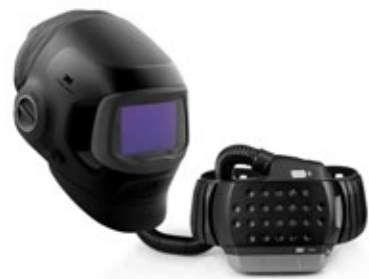
3M Speedglas G5-03 puhallinsarja G5-01/03TW + Adflo 109-637720 G5-01/03VC + Adflo 109-637730

Raskaan teollisuuden ympäristössä työskenteleville 3M™ Adflo™ -sarjan moottoroitu hengityssuojain tarjoaa yhdessä Speedglas™ G5-01 -sarjan raskaan käytön hitsausmaskijärjestelmän kanssa tehokasta hiukkashengityssuojaa hitsaajille kestävällä mutta pienikokoisessa rakenteessa, johon kuuluu myös ergonominen säädettävä päänauhasto.