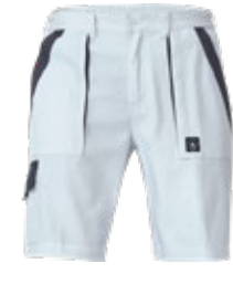
MAX NEO maalarinshortsit 6500-03570025800

Riipputaskulliset Fristads 2598 LWS rakentajan shortsit. Kevyt 4-suuntaan joustava stretch-materiaali mahdollistaa erinomaisen työskentelymukavuuden. Ripstop-stretch vahvikkeet ja toiminnalliset taskut tarvitsemillasi ominaisuuksilla.