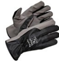
Työkäsine joustobritex 651-T109PU Asentajan työasormikas syntetistä PU/Amara-kuitua. Joustava britexselkä. Ihoystävällinen vaihtoehto nahkakäsineille.