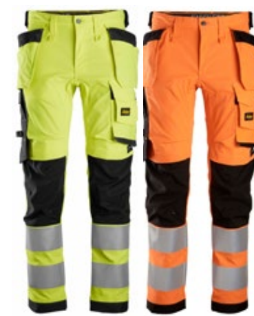
Snickers 6243 huomiohousut riipputaskuilla LK2 6500-62436

Fristads 2706 PLU High vis rakentajan stretch housut LK1. Huomiotyöhousut, joissa on erittäin joustavat, yliveraisen mukavuuden ja hyvän liikkumavapauden varmistavat stretchpaneelit. Kestävä päällyskangas likaa, öljyä ja vettä hylkivää materiaalia, sisäpuoli pehmeää puuvillaa. Voidaan pestä 60 asteessa.