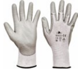
FF Stint Light viiltosuojäkäsine B-luokka 651-HS04017 Saumaton viiltosuojäkäsine. EN 388: 2016 4342 B-luokka. PU-pinnoitettu. Joustava resori.