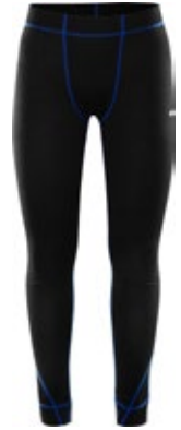
Fristads 2517 MW merinovillaiset pitkät alushousut 6500-127445

Fristads 7517 MW merinovillainen aluspaita on mikromerinovillasta valmistettu pitkähihainen t-paita, joka on hyvin eristävä eikä kutita.