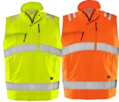
Fristads Green 5067 GPLU työnjohtajan liivi 6500-134242

Kaksi rintataskua ja kaksi sivutaskua vetoketjulla. Sisäpuolella kaksi suurta verkkotaskua. Henkilökorttitasku. Säädettävä helma. Pidennetty selkäkappale. Kauluksessa fleecavuoraus. Vettä hylkivä ja tuulenpitävä. Fluoresoivat värit. 50 mm heijastimet.