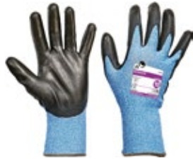
Bonasia FH viiltosuojäkäsine B-luokka 651-bonasia Erittäin ohut viiltosuojäkäsine, jossa on polyuretaanipinnoite (PU). Viiltosuojaluokka B. Koot 6-11. Nipussa 12 paria, laatikossa 120 paria. Täyttää EN 388 3X42B vaatimukset.