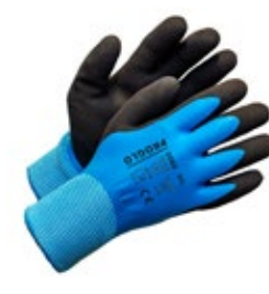
Proglo 3060 talviviiltosuojäkäsine D-luokka 651-PROGLO3060 Lateksilla tuplapinnoitettu D-luokan viiltosuojäsormikas UHMWPE-kuitua. Pitävä ja vedeltä suojaava käsine myös selkäpuolelta. Lämmin karhennettu akryylivuoraus. Viiltosuojaluokka D.